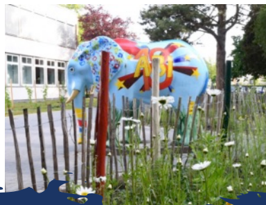
Schule ohne Rassismus

“Das habe ich noch nie gemacht, deshalb bin ich völlig sicher, dass ich es schaffe.”