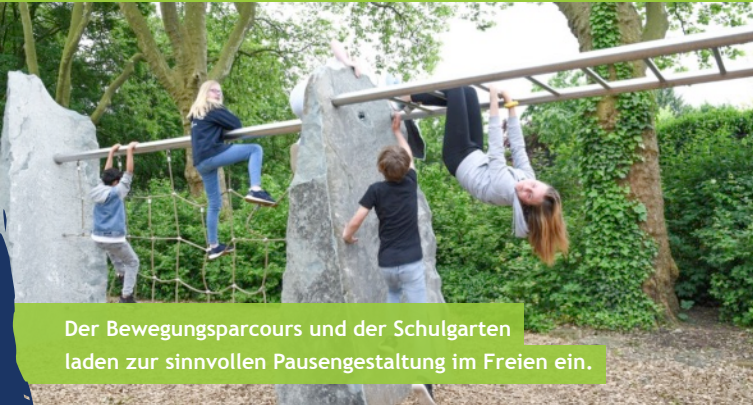
Der Bewegungsparcours und der Schulgarten laden zur sinnvollen Pausengestaltung im Freien ein.

Ein respektvolles und wertschätzendes Miteinander ist uns wichtig. Dieses vermitteln wir unter anderem auf der Föhrfahrt der Jahrgangsstufe 6. Eng arbeiten wir mit Ihnen als Eltern und mit Ihren Kindern in der Schulgemeinde zusammen.